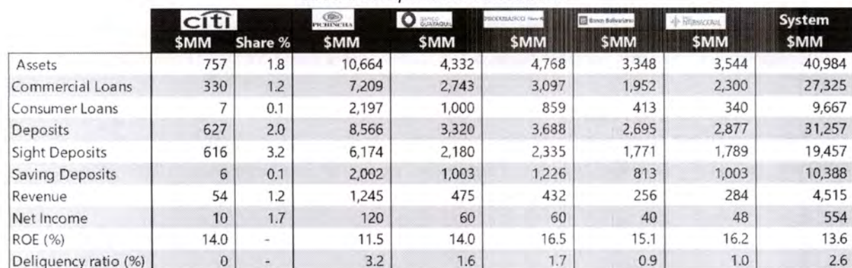
Cuadro Comparativo de mercado

Citibank, N.A. Sucursal Ecuador cuenta con la calificación de riesgo más alta del mercado AAA (Sep/2018), otorgada por Bankwatch Ratings.