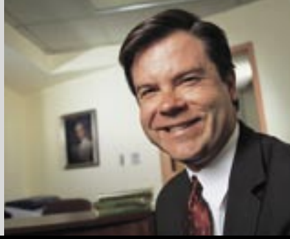
ألكس كوتنس، رئيس مؤسسة غرامين الولايات المتحدة وكبير مدراءها التنفيذيين

وبناء على التزامنا الذي قطعناه في عام ٢٠٠٤ لاستثمار ٢٠٠ مليون دولار على امتداد ١٠ سنوات في إطار دعم التثقيف المالي، منحت سيتي غروب في عام ٢٠٠٥ ما يقارب ٣٠ مليون دولار كهيئات وتعهيدات حول العالم. واشتملت بعض البرامج على «مغامرات الوكيل بيني وقوة الإرادة»، وهو عبارة عن حملة وصلت إلى حوالي ٥٠,٠٠٠ طفل في آسيا. علاوة على ذلك، قامت أعمالنا بتمويل مبادرات كـ «سابر كونتا: المعرفة يحسب لها حساب»، وهو عبارة عن مشروع مشترك بين بنك بانامكس والحكومة المحلية والوكالات غير الحكومية ويفيد