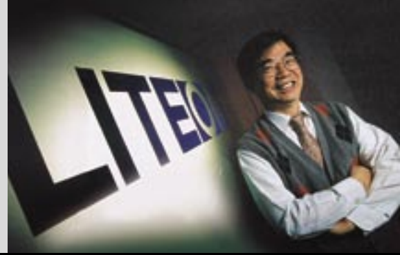
رايموند سونث، رئيس مجلس إدارة لايت-أون غروب. آسيا

“عمليات مصرفية خاصة متكاملة مع لمسة مصرفية استثمارية. هذا كل ما أتطلع إليه وأتوقعه من أي مزود لخدمات إدارة الثروات. إذ أن الثروة الشخصية لأي شخص مربوطة بشكل معقد بمصالح أعماله. سيتي غروب تفهم كل هذه الأمور بشكل جيد.”